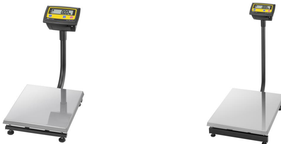
модификации EM-30KAM, EM-60KAM

Весы оснащены интерфейсом RS-232C для связи с периферийными устройствами (например, персональный компьютер, принтер).